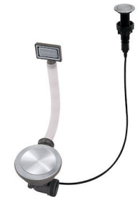
Automatischer Abfluss Space Push 8407 116