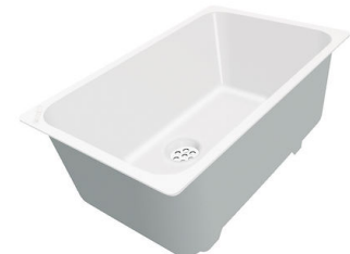
Weiße Wanne 8153 100