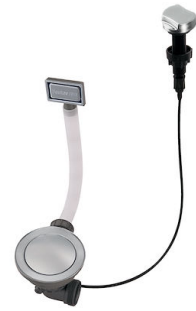
Automatischer Abfluss Space 8407 109