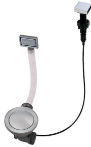
Automatischer Abfluss Space 8407 108