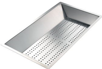
Perforierte Edelstahlwanne 8151 000 * nur in Kombination mit dem Zubehör 8644 101