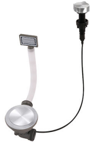
Automatischer Abfluss Space Milano 8407 115