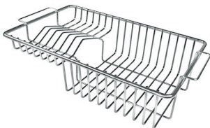
Tellerkorb aus Edelstahl 8100 201