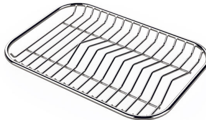
Tellerständer aus Edelstahl 8100 154