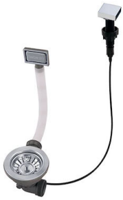
Automatischer Abfluss 8407 113