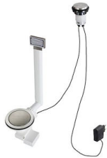
Automatischer Abfluss Space Light 8407 117